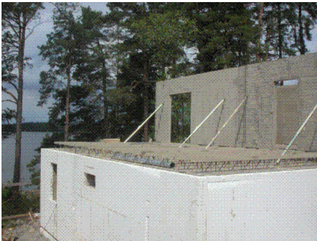
Övervåningens hjärtväggar monteras.