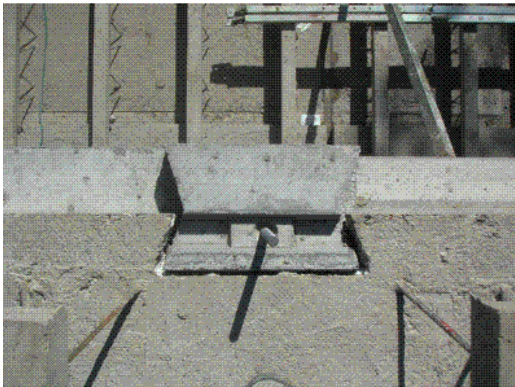
Hjärtväggarna har dubblerade tänder. Bjälklagsskarv. Ena bjälklagselementet monterat.