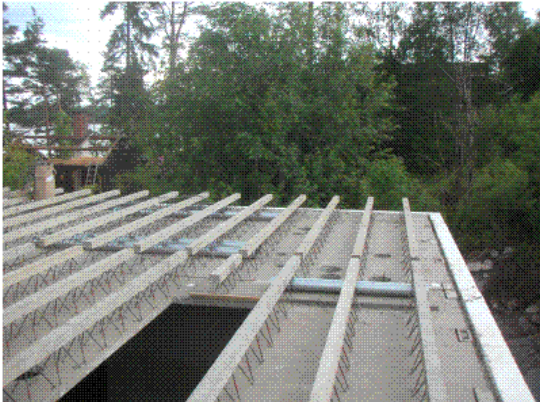
Ytterväggsisoleringen täcker bjälklagsskivan.